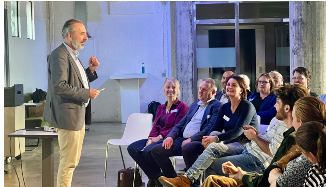
Kennis- netwerkdag Bodem Oost-Nederland, 11 november 2025

De Gelderse gemeenten financierden 50% van de activiteiten van het GOO (naar inwoneraantal), evenals Provincie Gelderland. Een overzicht van de bestedingen in 2025 door het GOO is weergegeven in bijlage 1.