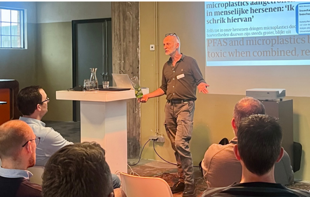
Kennis- netwerkdag Bodem Oost-Nederland, 11 november 2025

Binnen het Gelders Ondergrond Overleg waren in 2025 twee werkgroepen actief: de Werkgroep Implementatie Omgevingswet en de Werkgroep Data en Informatie. Beide werkgroepen werkten intensief samen aan praktische instrumenten, kennisdeling en gezamenlijke Gelderse aanpakken voor bodem- en ondergrondvraagstukken. Ook was in 2025 een tijdelijke werkgroep actief om af te stemmen over de samenwerking bij beoordeling van verspreiding van verontreinigingen bij meldingen en aanvragen voor grondwateronttrekkingen.